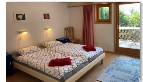
Geräumiges Doppelschlafzimmer (EG)