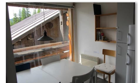
Esstisch in der Wohnküche

Weitere Fotos unter www.ferienhaus-coray.ch